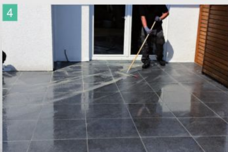
4 Überschüssigen Fugenmörtel abtragen