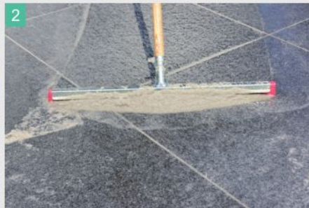
2 Geschmeidige Konsistenz mittels Gummischieber in die Fuge einbringen