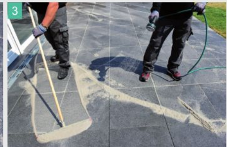
3 Die Fläche während des Fugens stets feucht halten