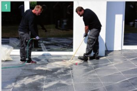
1 Material mit dem Wassersprühstrahl befeuchten