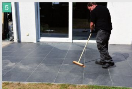
5 Mörtelreste gegebenenfalls abkehren