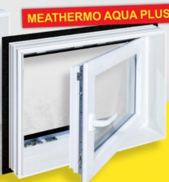
MEATHERMO AQUA PLUS