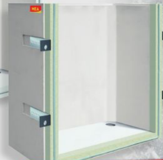
MEAVECTOR AQUA PLUS