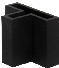
Abbildung 2: FK-T extra hoch + breit