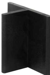
Abbildung 3: FK-T extra hoch