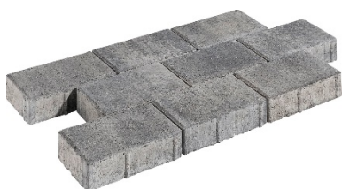
20 x 10 x 6 cm