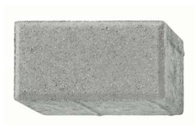
20 x 10 x 6 cm