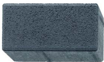
20 x 10 x 8 cm