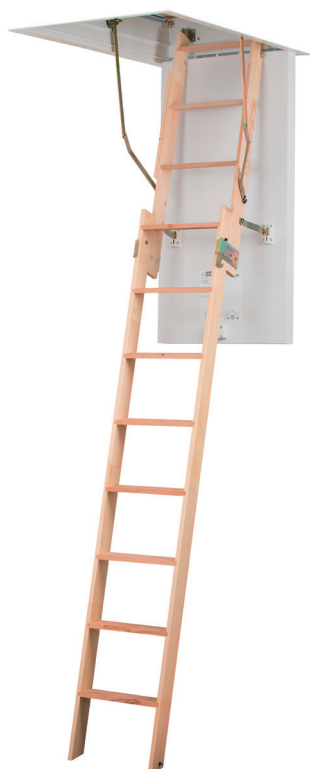
Die Bodentreppe mit TOP-Wärmedämmung und leichtem Einbau