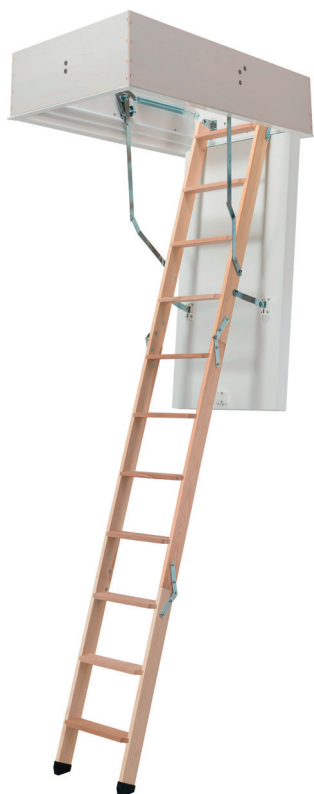
Die Bodentreppe mit TOP-Wärmedämmung und leichtem Einbau